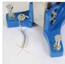
Integrerad center indikator